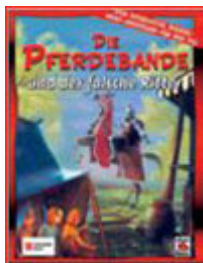
Die Pferdebande 3

Derzeit entsteht bei den Entwicklern eine neue Technologie, um die Figuren im Spiel möglichst realistisch mit Kleidung und Gegenständen ausrüsten zu können. Die Entwickler beschreiben dies treffend als „Playmobil“-System: Spielcharaktere können mit diesem System wie virtuelle Puppen bekleidet und mit Ausrüstungsgegenständen versehen werden. Bisher war dies in Computerspielen nicht so einfach möglich.