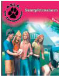
Die Tierspürnasen 2