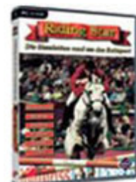
Riding Star 2

Das Produkt befindet sich derzeit in der Pre-Production, eine erste spielbare Version, die schon grundsätzlich zeigt, wie das spätere Produkt aussehen wird, ist fertig gestellt worden.