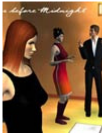
Kiss before Midnight